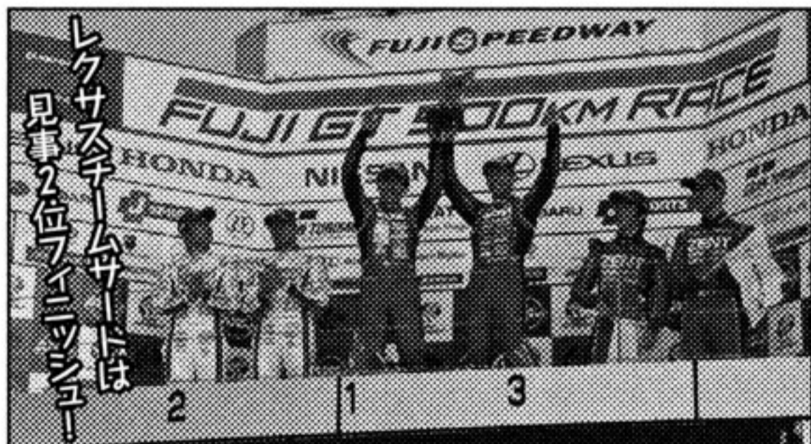
2人が観戦したのは、スーパーGT第二戦・富士GT500kmレース。ヤンマガとコラボしたチームサードが2位表彰台に輝いた。