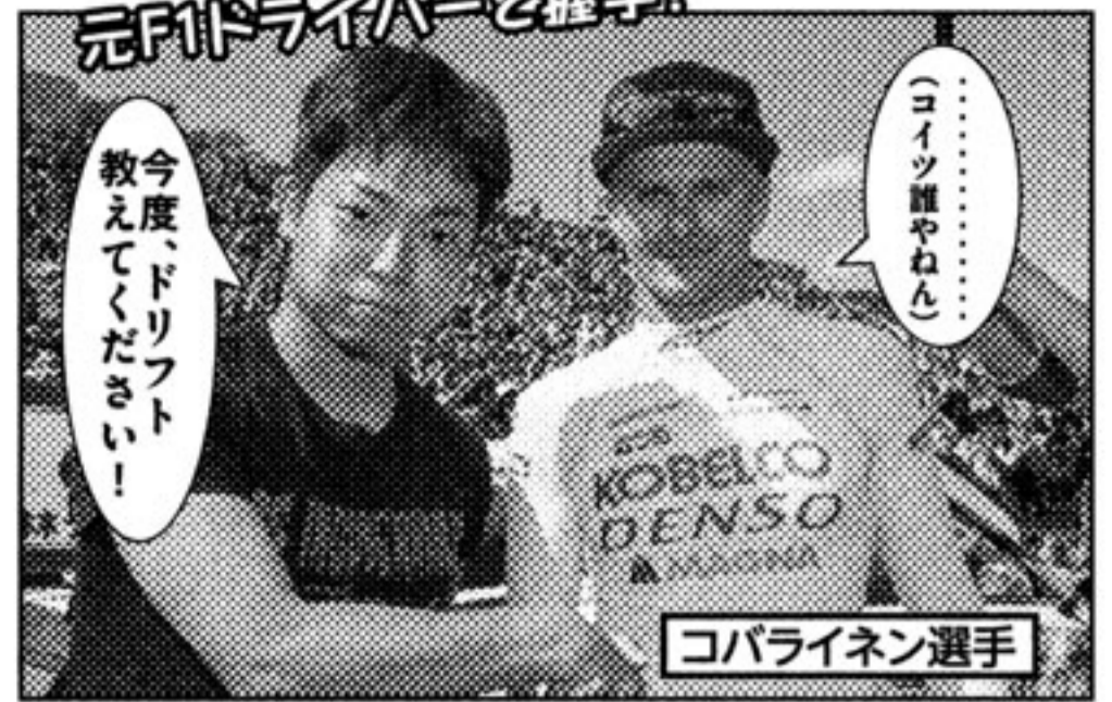
コバライネン選手

元F1ドライバーで、2016年のGT500チャンピオンでもあるヘイキ・コバライネン選手に馴れ馴れしくするゆとり世代のミズタニ。